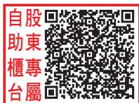
自股 助東 櫃專 台屬